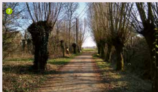
Bergendale (Heden Avanco Adventure & Events).

② Voor alle duidelijkheid, je wandelt nu op lus 2 (7 en 10 km). Stap de brug over de E17 over. Rechts ligt de transportzone LAR. Noteer het ruimtebeslag van een autosnelweg en sta stil hoe weinig ruimte een spoorbaan inneemt. Wie zin heeft het monument De Sjouwer een bezoek te brengen kan links de Burgemeester Margotstraat opwandelen (afb 5) (Een omweg van 2 x 230m). Bij de toren bevindt zich een mobiele netwerkpaal vermomd als altijd groene boom (afb 6). Stap de straat vervolgens terug naar beneden. Negeer wat verder rechts een doodlopende straat onder de spoorwegberm. Hou bij de splitsing van de weg rechts maar hou dan even verder links (dus niet onder de viaduct stappen) om een smal slingerend pad langs een huis te vinden (afb 7). Het pad stijgt dan vervolgens snel op naar de Blauwkasteelstraat. Negeer rechtdoor het Papeyepad, maar stap de Blauwkasteelstraat rechts in. De straatnaam verwijst naar het nabijgelegen Blauwkasteel dat verdween in het begin van de 20ste eeuw. Blijf de straat volgen (negeer een afslag naar links bij de opslagplaats van de pannenfabriek). De straat wordt verder met knotwilgen afgezoomd. Stap vervolgens onder het viaduct door en vind na enkele meters rechts de Losfeldvoetweg. Stap de voetweg op. De weg (ongeveer 700m lang) loopt parallel met de spoorwegberm. De voetweg mondt uit bij Hoeve Te